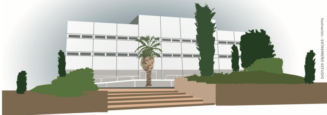
Ilustración : EXTREMENO ESTUDIO