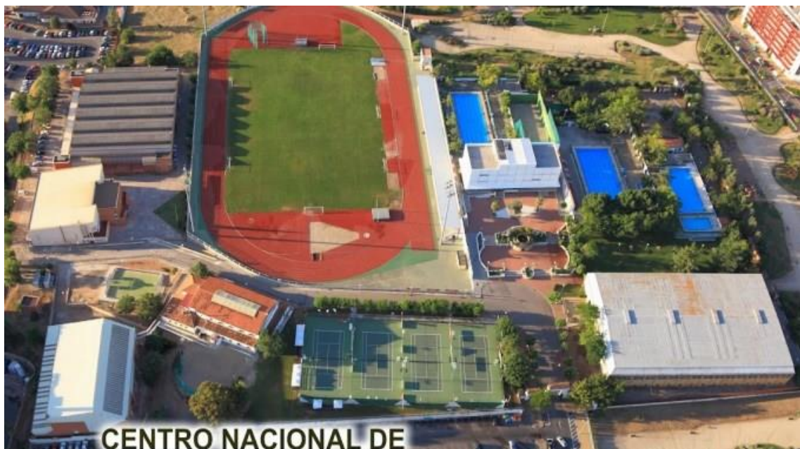
CENTRO NACIONAL DE

JUNTA DE EXTREMADURA DIRECCIÓN GENERAL DE DEPORTES